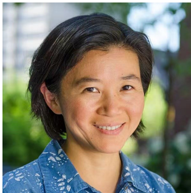
特邀嘉宾陈岩教授线上带来主题演讲

随后，来自密西根大学的特邀嘉宾陈岩教授线上作了题为《零工经济中的虚拟团队》的演讲。陈岩教授的研究探究了虚拟团队对员工生产力和在线平台保留率的影响。零工经济被誉为工作的未来，为全球数百万工人提供了灵活，低障碍的工作。但是，缺乏组织身份和社会纽带会导致零工平台很高的流失率。为了检验虚拟团队的影响，陈岩教授团队在全球乘车共享平台（滴滴）上进行了 27,790 名司机的大型田野实验，将司机随机分配给三个实验条件之一的某个团队。受试司机将获得其团队或个人排名，而对照组中的司机只能获得个人的绩效信息，而没有社会比较信息。陈岩教授发现，受试司机的生产力要高于对照组中的司机。陈岩教授还发现，在实验结束后三个月，受试司机在平台上的工作时间更长。最后，虚拟团队中的落后司机群体从团队竞赛中获益最大。